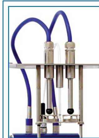
de dépose les billes electromagnétiques (solution confortable de Petrotest®)