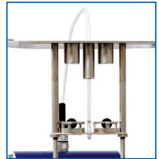
de dépose les billes manuelle (solution à la norme avec les guides de centrage)