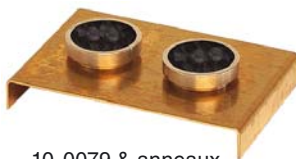
10-0079 & anneaux

Pièces de rechange 10-0052 Guide de centrage 10-0841 Potence de test “RKA 5 - guide de centrage” pour 2 guides de centrage & 2 système électromagnétique 10-0850 Systèmes électromagnétiques de positionner les billes 17-0158 Fourreaux , verre (to hold the ball dispenser or Pt-100)