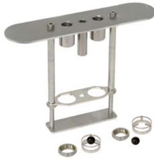
Potence de Test est apte à : - solution à la norme avec 2 guides de centrage (10-0841, 2x 10-0052) - combiné avec le système électromagnétique de positionnement des billes et les guides (10-0851)