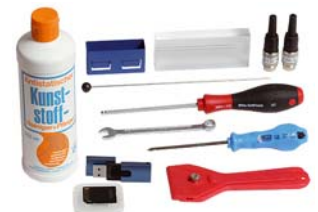
Kit de service 10-0868