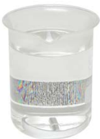
10-0856 (& agitateur)

10-0840 Potence de test “RKA 5 - positionnement mécanique” avec système de centrage & positionnement mécanique