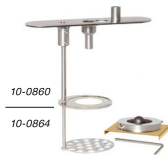
10-0860 10-0864 Potence de test modifié avec l'accessoires similaire de méthode Wilhelmi (10-0860 & 10-0864)