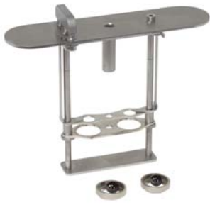
Potence de test avec système de centrage & dépose bille mécanique (10-0840 et accessoires)