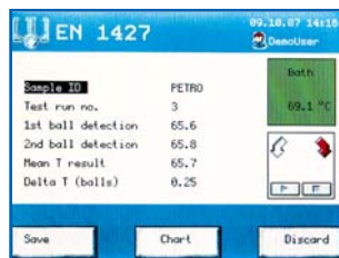
afficher le résultat