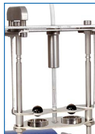
solution de centrage & dépose mécanique de Petrotest® (10-0840) (compris dans la livraison standard)

navigation dans les menus par technologie Jog-Wheel (tournez et appuyez!)