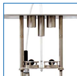
solution de centrage à la norme avec guides de centrage (10-0841 & 2x 10-0052) (en échange pour solution Petrotest® à demande)

L'appareil RKA 5 contient la technologie microprocesseur allié à un système d'opération intuitif Jog-Wheel .