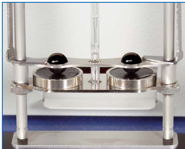
billes en position