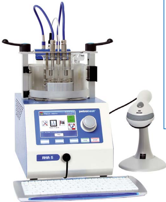
RKA & 10-0851 & 25-0910 & 25-0920