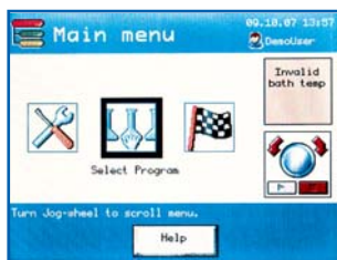
choisir le programme