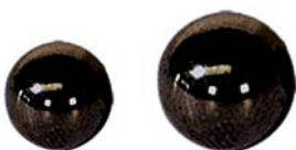
Billes (seulement pour l'appareil RKA5) (10-0805 & 10-0877)

Pièces de rechange 10-0075 Anneau (Wilhelmi) , fermeture à baïonnette 10-0877 Billes (Wilhelmi) , acier noircie (Ø 15 mm, 13,9 g), paquet de 10 10-0906 Bûcher (Wilhelmi) (1000 ml) bas avec bec verseur (en bain) 10-0846 Sonde de Température (Wilhelmi) Pt-100 (seulement pour 10-0860) 10-0865 Systèmes électromagnétiques de positionner les billes (Wilhelmi) 17-0237 Clé mâle à six pans (2 mm)