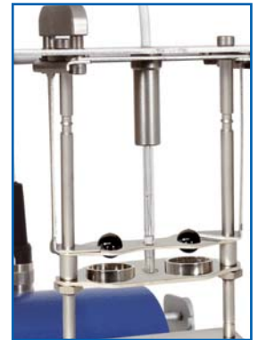
de centrage & dépose les billes mécanique (solution de Petrotest® et très pratique)