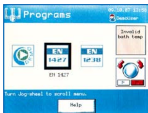
choisir le standard