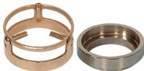
10-0052 & 10-0049

10-0851 Kit potence de test “RKA 5 - électromagnétique” avec système électromagnétiques de positionner les billes par l'automatisme de poser Composé de: 1 potence de test (10-0841) 2 systèmes électromagnétiques de positionner les billes (10-0850) 2 fourreaux (17-0158) 2 guides de centrage (10-0052)